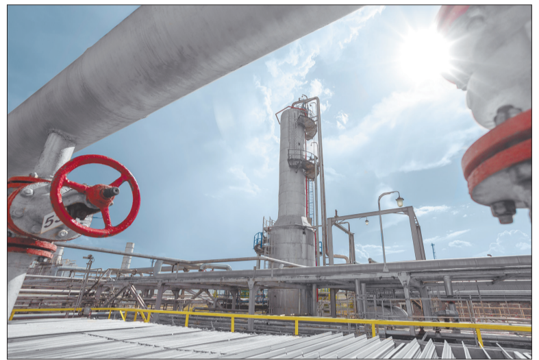
На Карабашской УКПН проведено техническое перевооружение систем пожаротушения печей нагрева нефти и теплоснабжения

Конечным результатом всех этих преобразований является безопасность, экономичность и высокое качество процессов подготовки и переработки нефти.