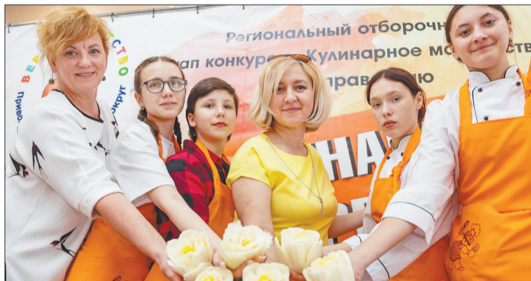
После творческого испытания участницы конкурса отправились на мастер-класс и изготовили из пекинской капусты бутон цветка

— Девочки соблюдали и технику безопасности, и технологию приготовления. Я, как работник общественного питания, за этим зорко следила.