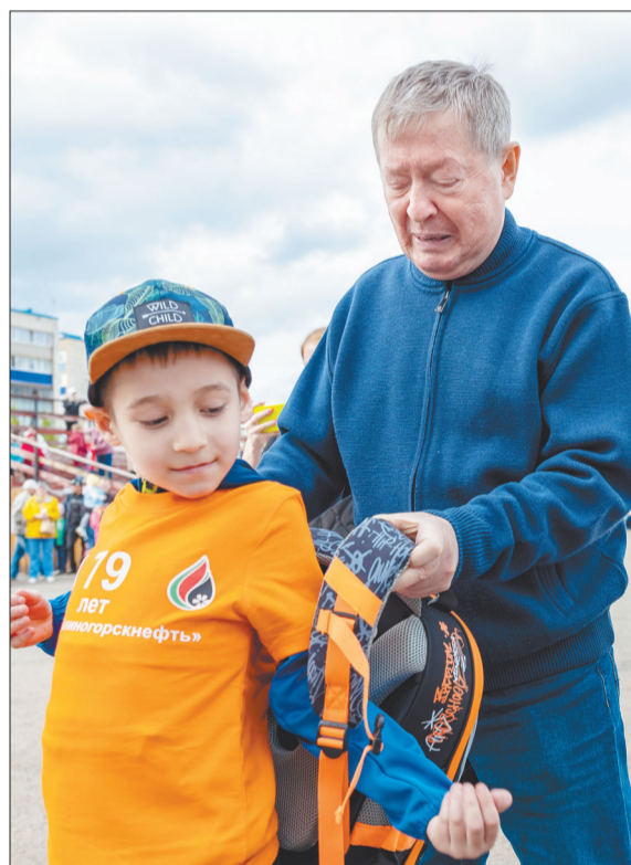
В день праздника нефтяники поощрили грантами отличившихся учеников и педагогов подшефных СПК школ, Лениногорского детского дома и нефтяного техникума

В нашу повседневную реальность стремительно врывается