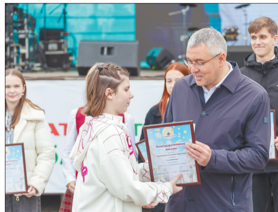
В день праздника нефтяники поощрили грантами отличившихся учеников и педагогов подшефных СПК школ, Лениногорского детского дома и нефтяного техникума