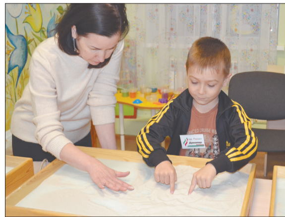
Песочная терапия увлекла и взрослых, и малышей

— Была реально терапия! Когда закрывали глаза, у меня даже получилось «остановить-