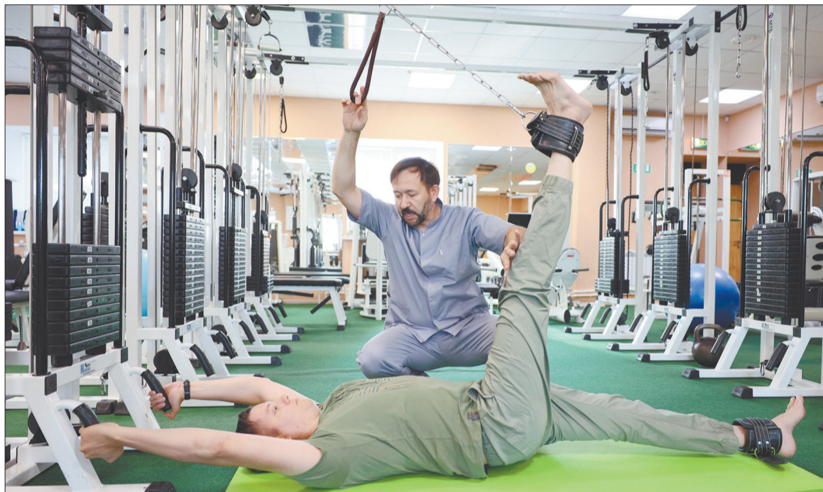
В санатории проводится реабилитация людей с заболеваниями опорно-двигательного аппарата с использованием кинезитерапии по методу Бубновского

Санаторий стремится применять в оздоровлении самые передовые и эффективные разработки. Так, специалисты «Лениногорского» в свое время прошли обучение в Академии прикладной кинезиологии и теперь проводят реабили-